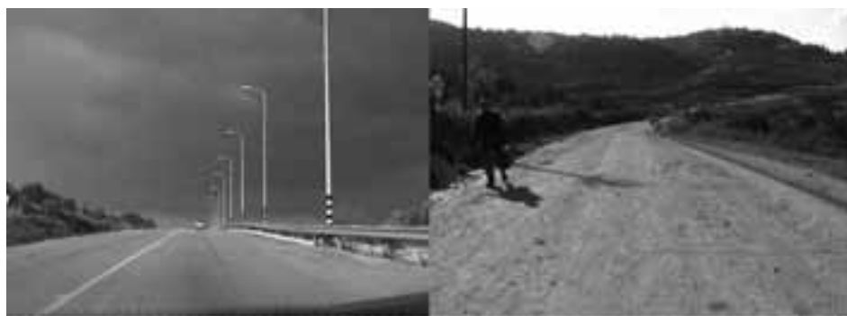
Viaggio da A a B, 2003 (fotogrammi Multiplicity)

tragitto è incerto, incrociamo diverse jeep dell'esercito israeliano che pattugliano le strade. I tassisti si chiamano con il cellulare per scambiarsi informazioni su quali strade siano percorribili e non pattugliate dai militari. Seguendo diverse strade tortuose, arriviamo ad Al 'Ubeidiya. Qui il tassista ci dice di scendere, perché più avanti c'è un checkpoint volante che non può aggirare con la macchina. Seguendo gli altri passeggeri, lo aggiriamo a piedi e più avanti, qualche centinaio di metri più a valle, troviamo altri tassisti che ci aspettano per portarci al prossimo checkpoint. Arriviamo ad Abu Dis. Il taxi si ferma accanto ai grandi blocchi di so-