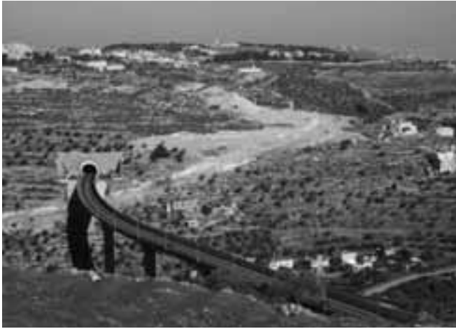
Bypass road n. 60, Beit Jalla